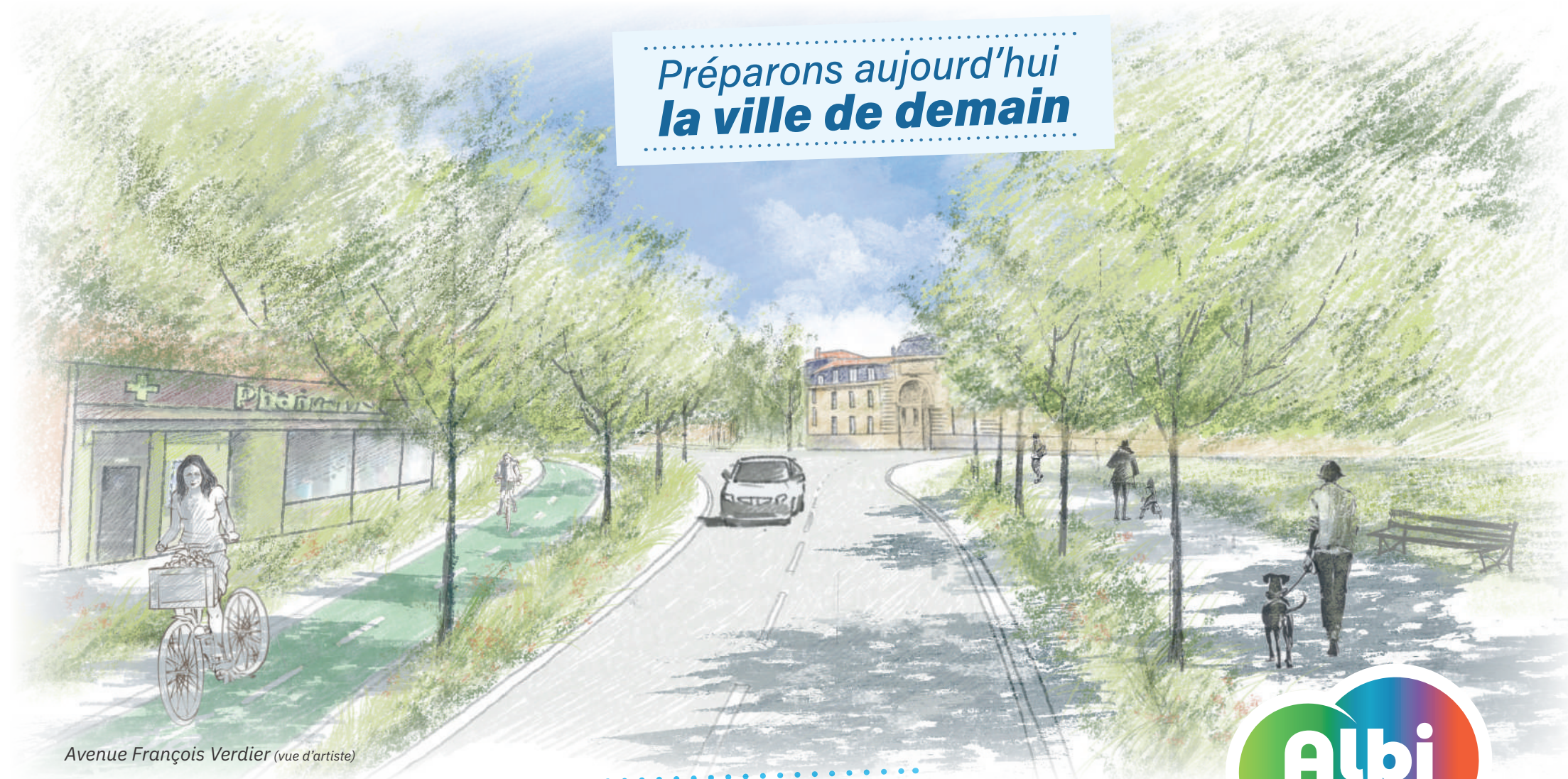
Avenue François Verdier (vue d'artiste)